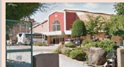
●市立南小学校 / 徒歩約9分