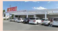
●ディスカウントストア ダイレックス様